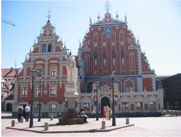
Haus der Hansegilde in Riga