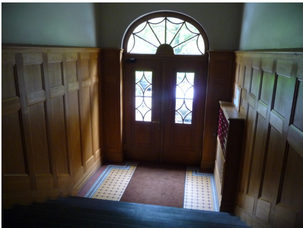
Büro Data Factories in Riga