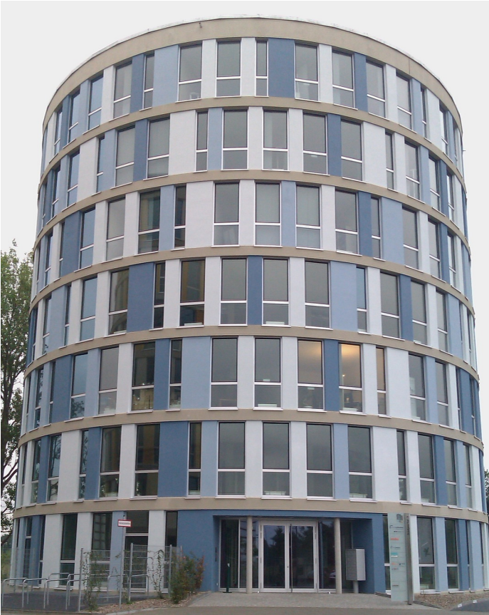
DATI-Hamburg in Norderstedt