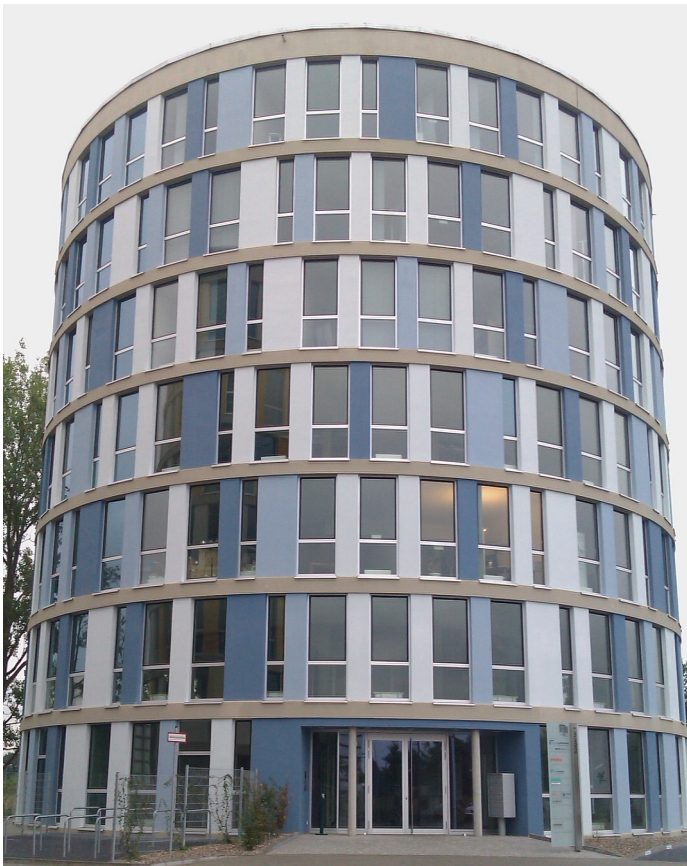
DATI-Hamburg in Norderstedt